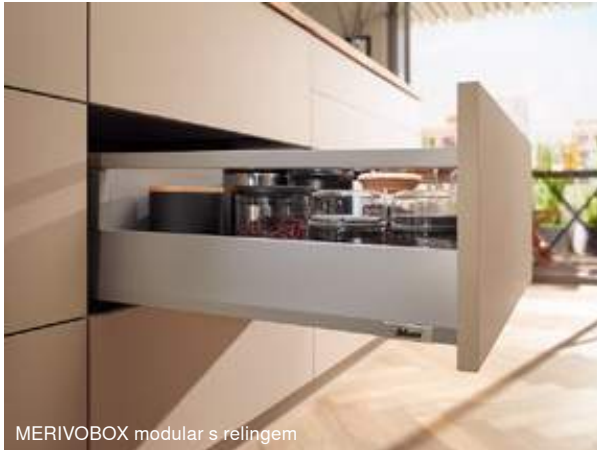
MERIVOBX modular s relingem