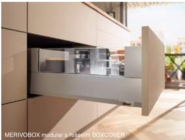
MERIVOBX modular s řešením BOXCOVER