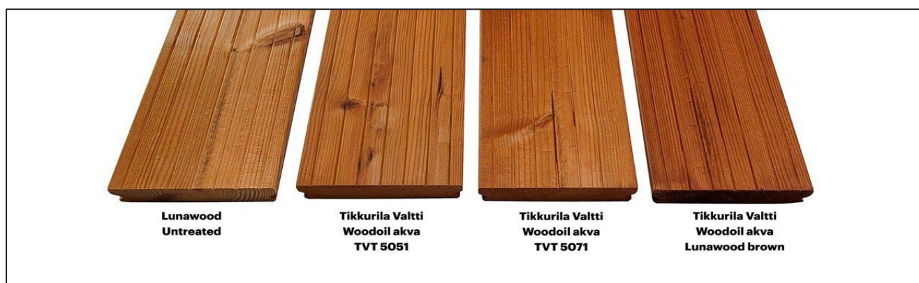
Srovnání olejů Tikkurila aplikovaných na termicky modifikované dřevo Lunawood

Aplikujte pigmentovaný olej na dřevo v 1–2 vrstvách, například Tikkurila Valtti Plus tónovaný hnědým pigmentem Lunawood, TVT 5051 nebo TVT 5071.