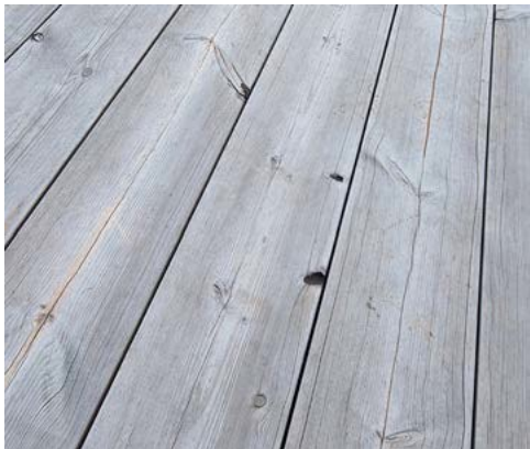
Neošetřená terasa Lunawood (termicky modifikovaná borovice) 2 roky po montáži. Na povrchu jsou vidět drobné vlasové praskliny.