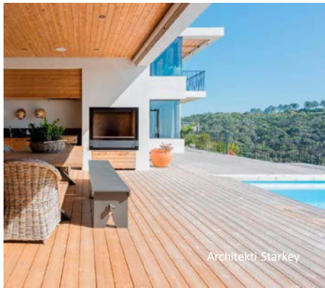
Terasa soukromého domu v Jižní Africe. Terasa na slunném místě zešedla rychleji, než na stinném míst