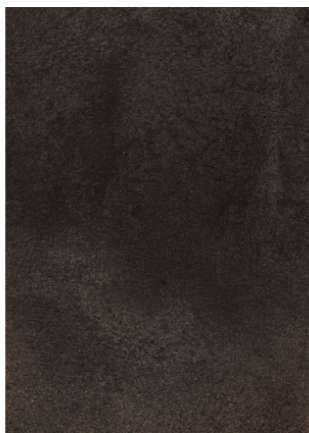
Náhled na celou desku