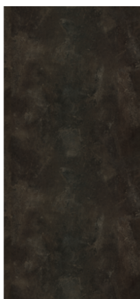
Náhled na celou desku