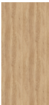
Náhled na celou desku