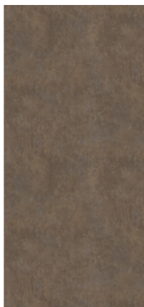
Náhled na celou desku