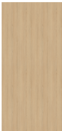
Náhled na celou desku