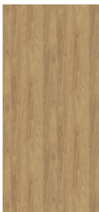
Náhled na celou desku