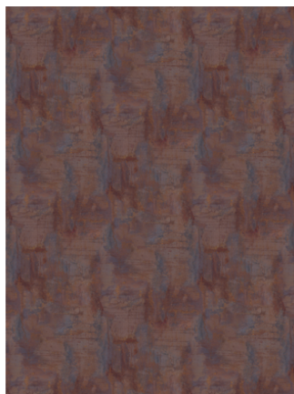
Náhled na celou desku