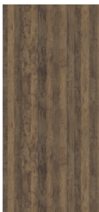
Náhled na celou desku