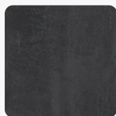
42238 DP Beton Dark Povrchová struktura Štuk