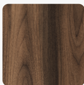
32339 AN Ořech Tortona Povrchová struktura Authentic