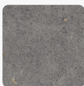
F208 ST75 Pietra Fanano šedá Povrchová struktura Mineral Satin