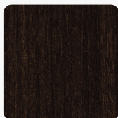
H3043 ST12 Eukalyptus tmavě hnědý Povrchová struktura Omnipore Matt