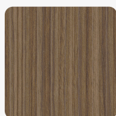
Riga LS54 RI Povrchová struktura Riga