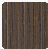
Riga LS53 RI Povrchová struktura Riga