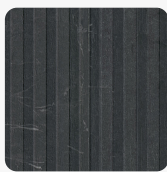
Riga FC18 RI Povrchová struktura Riga