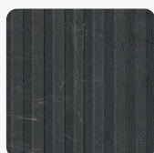
Riga FC18 RI Povrchová struktura Riga