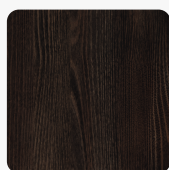
H1199 ST12 Dub Thermo černohnědý Povrchová struktura Omnipore Matt