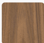
H1386 ST40 Dub Casella hnědý Povrchová struktura Feelwood Oakgrain