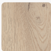
K2737 AX Dub Andora světlý

Povrchová struktura optionvalue.obl_KD_AX