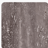
K2780 CN Travertin Modena

Povrchová struktura optionvalue.obl_KD_CN