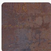
K4398 DP Rusty Iron Povrchová struktura Štuk