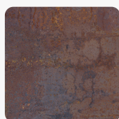
K4398 DP Rusty Iron Povrchová struktura Štuk