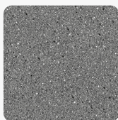
4288 PE Granit Antracit Povrchová struktura Perl