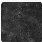
3953 PE Břidlice černá Povrchová struktura Perlička