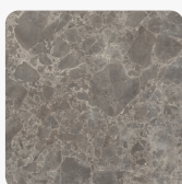
F095 ST87 Mramor Siena šedý Povrchová struktura Mineral Ceramic