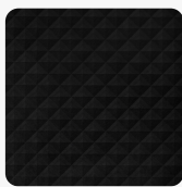
U129 CH Cheope Nero Povrchová struktura Cheope