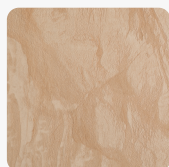
FC08 DU Duna Barragan Povrchová struktura Duna