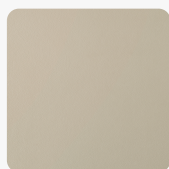
UA80 PF Primofiore Corda Povrchová struktura Primofiore